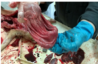
Рисунок 3 - Сердце пораженное фибринозным перикардитом

На поверхности листков перикарда видны рыхлые серовато-желтоватые наложения фибринозных масс. Наблюдали сращение перикарда с сердцем. Перикард покрывается как бы волосатым покровом. Такое сердце называют «волосатым».