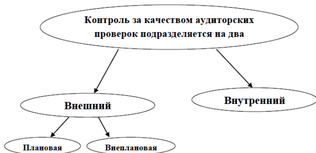
Рисунок 1 – Контроль качества аудиторских проверок

Данный контроль за качеством делится на два вида (рис. 1).