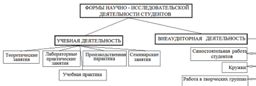
Рисунок 1 - Формы научно - исследовательской деятельности студентов

Форма научно – исследовательской деятельности студентов включает компоненты учебной и внеаудиторной деятельности (рис. 1).