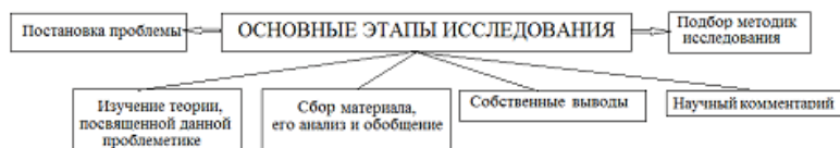
Рисунок 2 - Этапы исследования

Одним из важнейших условий научно-исследовательской работы является ее новизна, цели, задачи, практическая значимость полученных результатов.