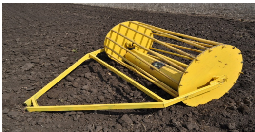
Рисунок 1 - Почвообрабатывающий каток (обозначения в тексте)

Результаты исследования. При проведении исследований в полевых условиях мы определяли влажность почвы двумя влагомерами TDR 100 и GMH 3850 (Greisinger Electronic GmbH, Германия) [5]. В результате было выявлено, что влажность почвы полностью удовлетворяла агротехническим требованиям к предпосевной обработке почвы.