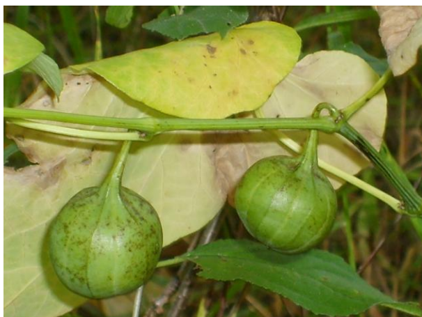
Плоды кирказона обыкновенного

Сем. Aristolochiaceae Juss. – Кирказоновые