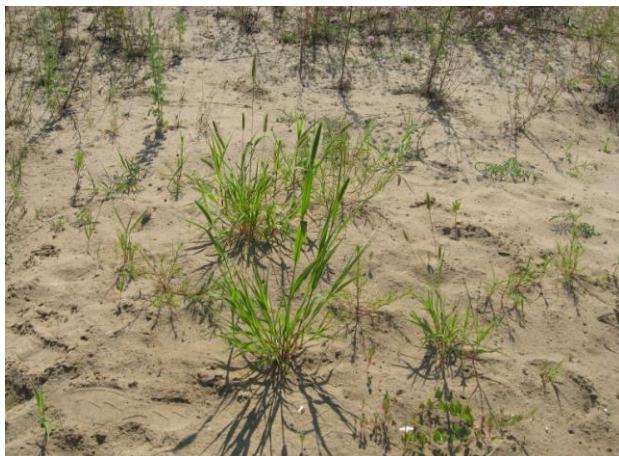
Первичные этапы зарастания насыпных грунтов

В исследуемой флоре зарегистрировано произрастание 13 «красно-книжных» видов. На территории урбанофлоры описано два ценных ботанических объекта – это урочища Березовая роща и торфяное болото.