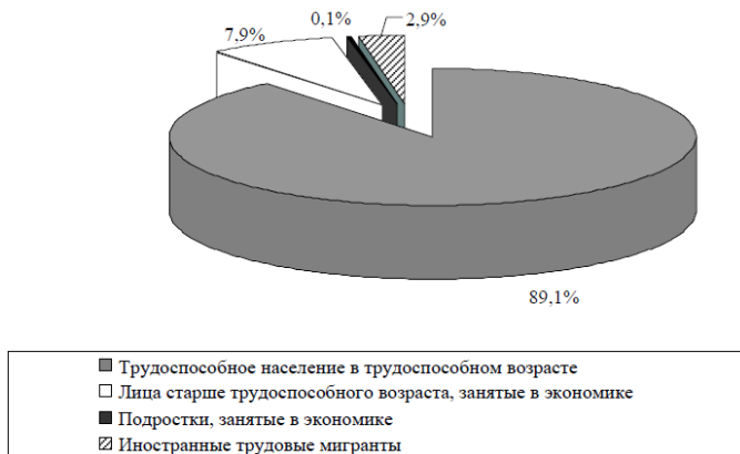
Рисунок 1 – Структура трудовых ресурсов РФ в 2017 году

Результаты исследований. Трудовые ресурсы РФ включают в себя трудоспособное население в трудоспособном возрасте, лиц старше трудоспособного возраста и подростков, занятых в экономике, а также иностранных трудовых мигрантов (рис. 1).