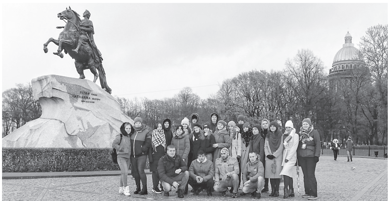
В конце октября победители конкурса «Лучший факультет» побывали в Санкт-Петербурге