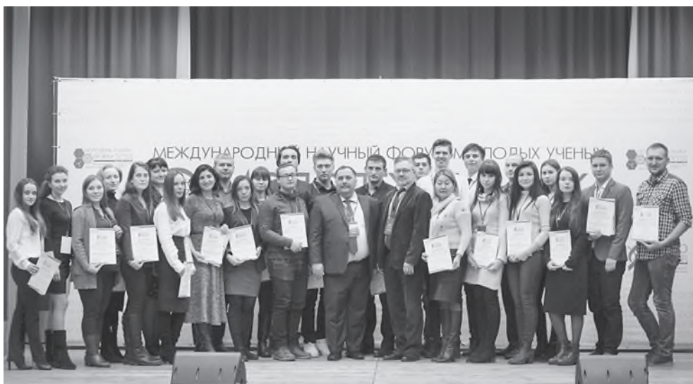
Участники и победители финала конкурса «UL-INNOVO 2018»