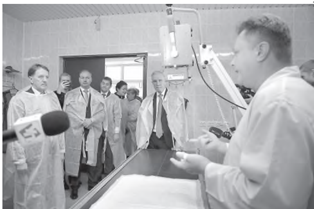
Вице-премьер РФ Алексей Гордеев высоко оценил потенциал Межквартального научного центра факультета ветеринарной медицины и биотехнологии, оснащенного современным диагностическим и лечебным оборудованием