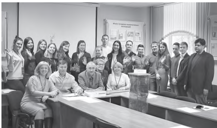
Участники секционного заседания «Агрономия, агроэкология, землеустройство и земельный кадастр. Химия и новые материалы»

В рамках конференции работало пять секций, на заседаниях которых студенты, аспиранты, научные сотрудники и преподаватели представ-