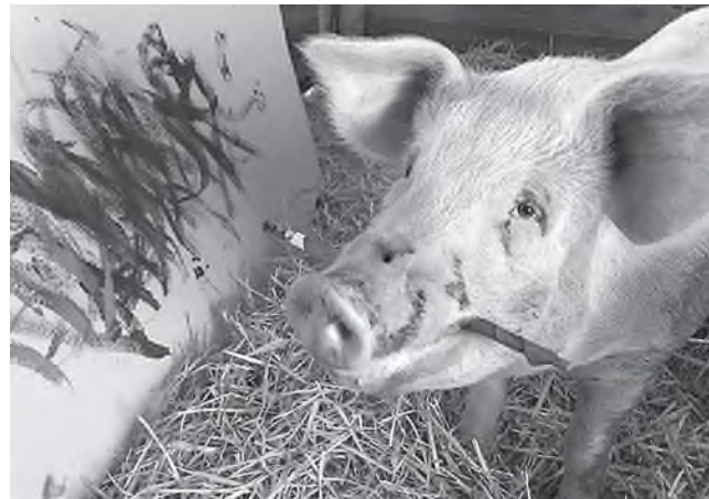
Свинка Пикассо рисует картины, которые раскупают за тысячи долларов

Своеобразным подтверждением этому являются древние легенды. В легенде, бытующей у жителей острова Мота из группы Банксских островов, рассказывается о том, что легендарный герой Кат некогда сделал людей и свиней по одинаковому образцу, но свиньи неожиданно захотели иметь собственные отличия. Тогда Кат одним ударом своего посоха пришиб свиней к земле, и после этого свиньи стали ходить на четырёх ногах, а люди продолжали ходить на двух.