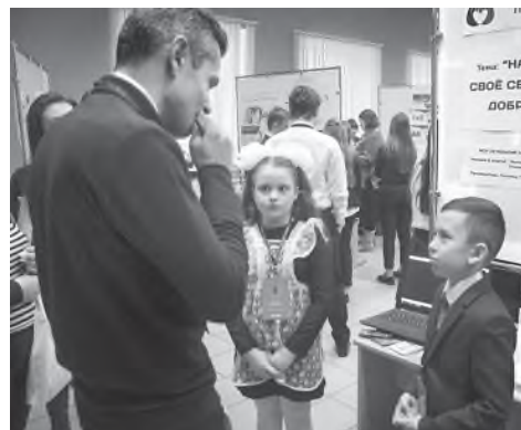
На выставке – конкурсе проектов школьников «Занимательная наука»