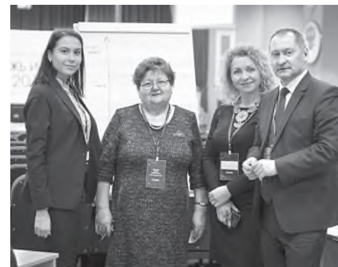
На форсайт-сессии по проблемам работы с одаренными детьми

ний Ульяновской области, а также Республики Татарстан в 5 номинациях: «Экология», «Малая Тимирязевка», «Человек – техника», «Социальная инициатива», «Домашняя лаборатория».