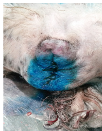
Рисунок 4 - В конце операции

ние вульвы; выпячивание и удлинение промежности с гнойными выделениями из половой щели [1,3].