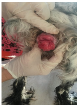
Рисунок 1 – Венерическая саркома у суки

Венерическая саркома (трансмиссивная саркома) — это злокачественная опухоль особого типа, которой болеют как самки, так и самцы собак, локализующаяся на слизистой оболочке перед входом во влагалище и возле полового члена. Также может распространиться на области рта, носа и конъюнктиву животного. Облизывание опухоли способствует переносу ее клеток, что значительно ухудшает состояние больного животного. Имеет вид вилка капусты (рис.1). Возбудителем данного заболевания является живая опухолевая клетка [1,2].