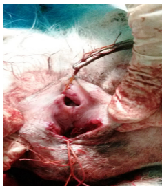
Рисунок 3 – Сшивание слизистых оболочек