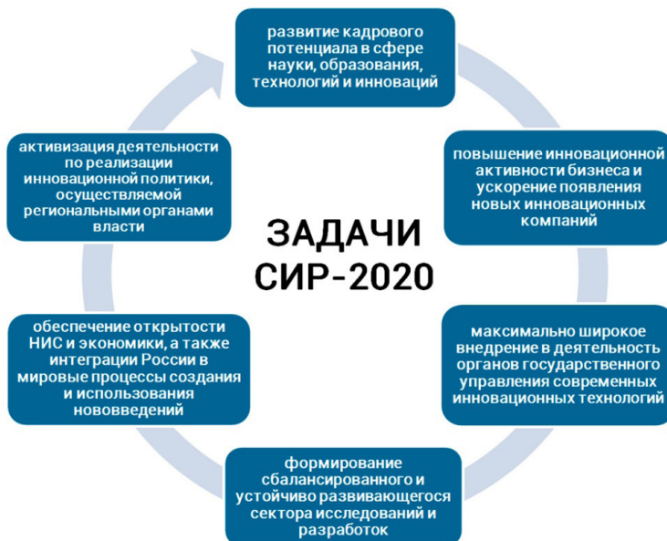
Рисунок 2 – Задачи развития инноваций в РФ на период до 2020 г.

В целом, в период с 2015 - 2017 гг. сложившаяся система, а также механизм обеспечения финансирования инновационной деятельности в Российской Федерации не в силах организовать более эффективное решение стратегических задач в области модернизации экономики и повышения конкурентоспособности страны, о чем свидетельствует таблица 1.