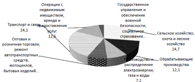
Рисунок 1 - Структура инвестиций в основной капитал по «чистым» видам экономической деятельности организаций Орловской области, %