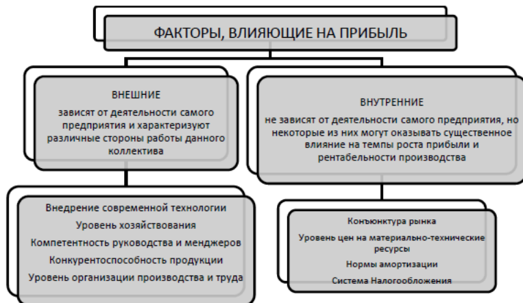
Рисунок 3 - Факторы, влияющие на прибыль