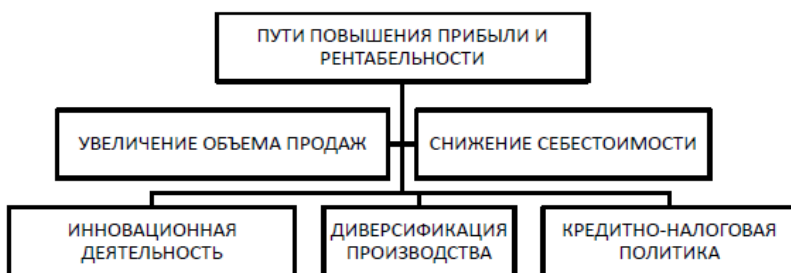
Рисунок 4 - Пути повышения рентабельности

Многообразие показателей рентабельности определяет альтернативность поиска путей ее повышения. (рис.4)