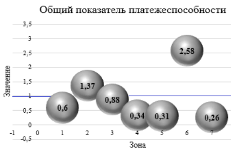
Рисунок 1 - Сравнение значений общего показателя платежеспособности по агломерационным зонам Ульяновской области