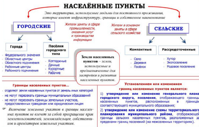
Рисунок 1 – Населенные пункты: понятие, виды, классификация

поселений, которая отделяет их от остальных регионов, городов, поселков.