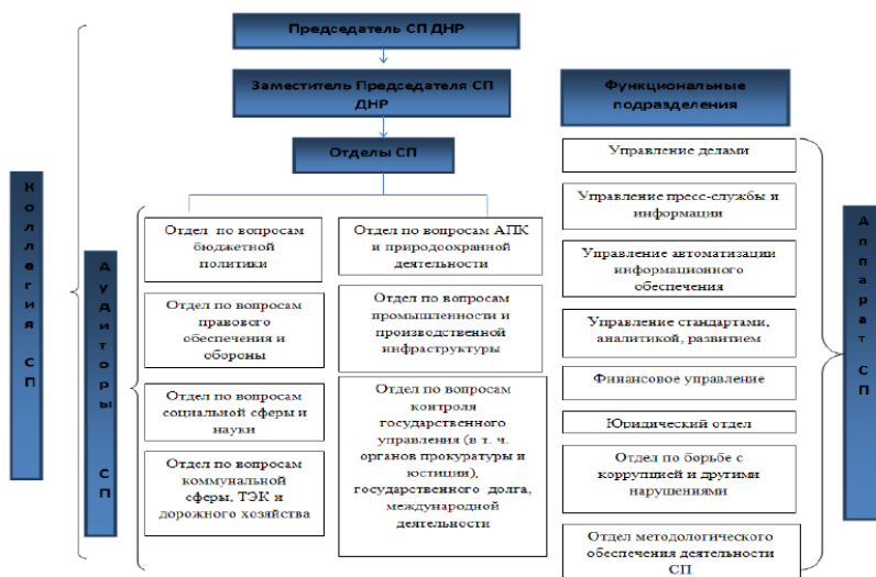
Рисунок 2 - Рекомендуемая организационная структура Счетной палаты ДНР [разработка автора]