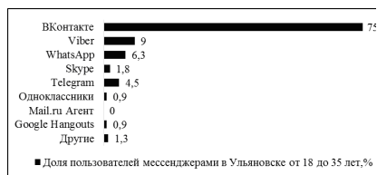
Рисунок 2- Доля пользователей мессенджерами Ульяновске