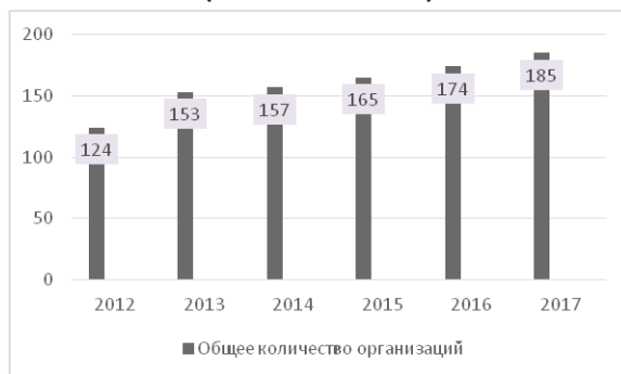
Рисунок 2 - Общее количество организаций, в отношении которых возбуждено производство по делу о банкротстве

Распределение по процедурам банкротства: