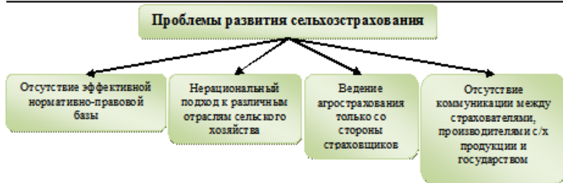
Рисунок 1 - Проблемы развития сельхозстрахования