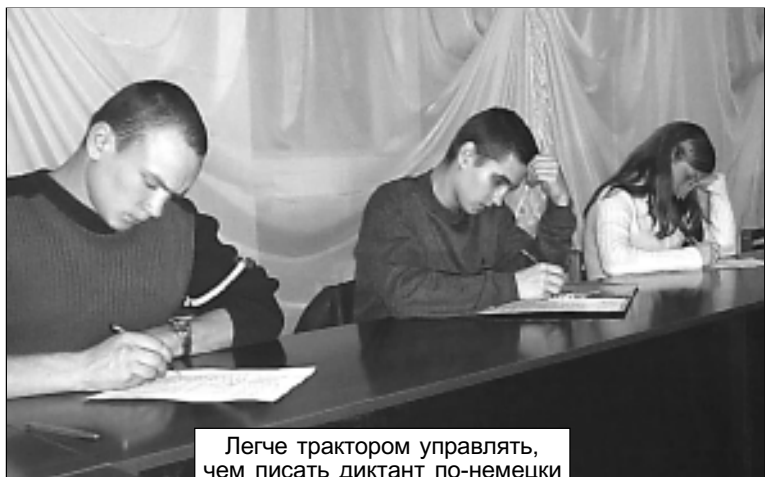
Легче трактором управлять, чем писать диктант по-немецки

21 февраля в академии состоялся второй отборочный тур для студентов, желающих поехать на производственную практику в Германию в рамках продолжающегося сотрудничества между УГСХА и организацией ЛОГО, сотрудничающей со многими вузами России вот уже 10 лет.