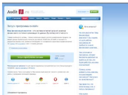
Рисунок 1 – Диалоговое окно программы. Запуск программы на исполнение.

Программа «Ваш финансовый аналитик» – это система интеллектуального анализа финансового состояния организации по данным бухгалтерской отчетности.