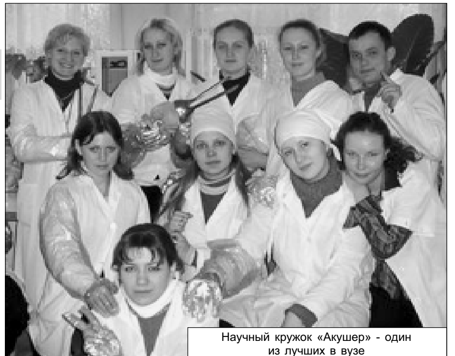
Научный кружок «Акушер» - один из лучших в вузе