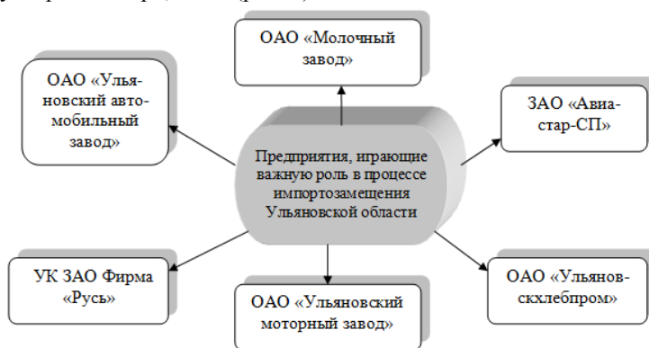
Рис. 3 – Предприятия, играющие важную роль в процессе импортозамещения

Можно сказать, что в рамках программы импортозамещения Ульяновская область стала конкурентоспособной по цене и качеству. Область имеет достаточно большой завод «Авиастар» - сердце промышленного регионального кластера. Местная автомобильная промышленность достаточно стабильна в объемах производимой и продаваемой продукции. На фоне других автомобильных заводов в России, где резко упали объемы производства, автозавод «УАЗ» едет «вперед», имеет достаточно хорошие финансовые показатели. Также в Ульяновской области имеется порядка 70 крупных предприятий, в том числе, и конструкторских бюро, НИИ (рис. 3).