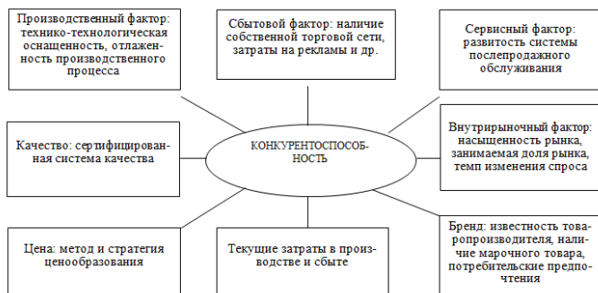
Рис. 1 – Факторы повышения конкурентоспособности продукции [1]

По мнению Елатонцева Н.Н. для успешной конкуренции и заполнения соответствующих ниш рынка предприятиям аграрного профиля необходимо активно развиваться в следующих направлениях: