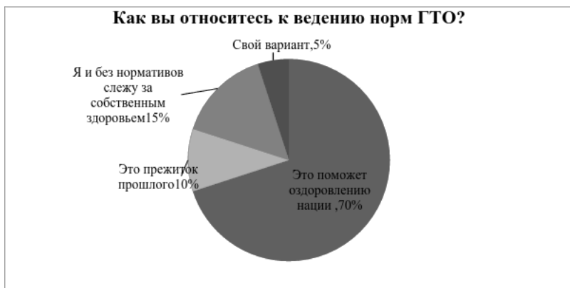
Рисунок 1 - Диаграмма ответов на вопрос «Как вы относитесь к ведению норм ГТО?»