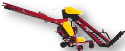
Рисунок 2 – Зернопогрузчик самопередвижной ЗПС-100