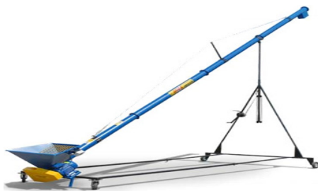
Рисунок 3 – Шнековый транспортер ТШ – 403

На рисунке 3 изображен шнековый транспортер ТШ – 403, его технические характеристики указаны в таблице 2.