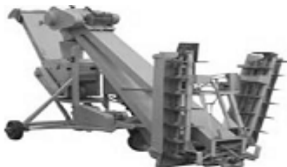
Рисунок 4 – Зернометатель электроприводной самопередвижной ЗМЭ-60