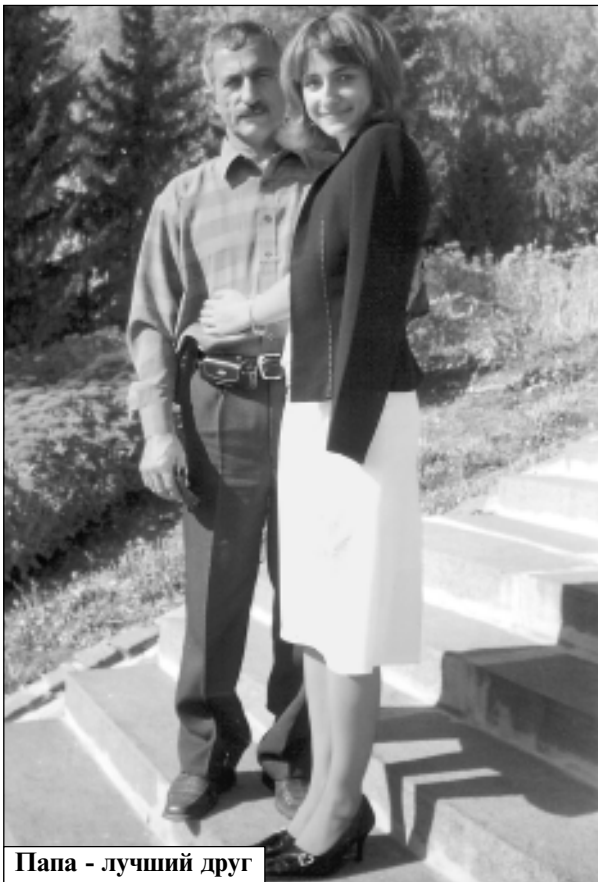
Папа - лучший друг