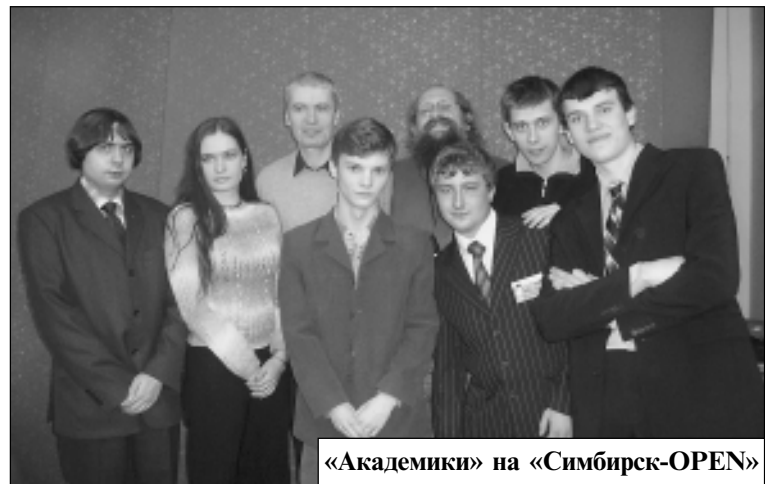
«Академики» на «Симбирск-OPEN»

Но академический интеллектуальный чемпионат был не главным апрельским событием подобного рода. 15-го и 16-го апреля Ульяновск принимал гостей из многих городов нашей страны: Саранска, Казани, Саратова, Самары, Нижнего Новгорода, Москвы и др. А съехались они по поводу проводимого в эти дни