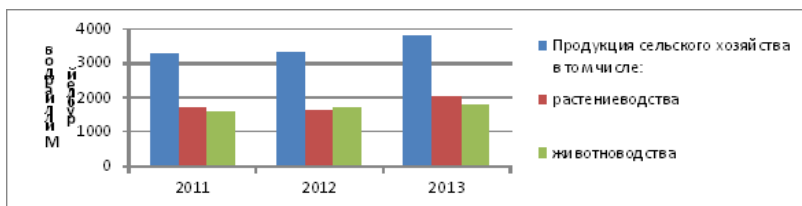
Рисунок 1 - Показатели продукции сельского хозяйства по годам в рублях