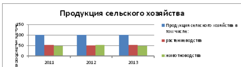
Рисунок 2 - Продукция сельского хозяйства по годам в процентах